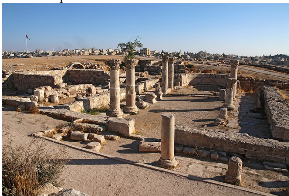
Рис. 5. Византийская церковь VI в.