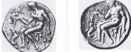
Рис. 3. Монеты, на которых изображены: 1) основатель Регия Иокаст с домашним котом, 720 г. до н.э. — отчеканена в Регии в 435 г. до н.э.; 2) основатель Тарента Фалант с домашним котом, 710 г. до н.э. — отчеканена в Таренте в 450 г. до н.э.

Монеты с изображением кота были отчеканены в середине V в. до н.э. во вновь основанных колониях в Южной Италии в Регии и Таренте. Они сидели рядом с предполагаемым ойкистом колонии (Рис. 3) 4 .