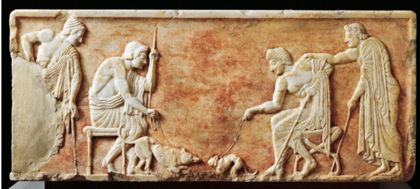
Рис. 4. Рельеф, изображающий кота и собаку перед схваткой. Окрестности Афин, 510 г. до н.э.

В классическую эпоху коты и кошки получили распространение в городах Балканской Греции, их стали изображать на рельефах, вазах, предметах декоративного искусства, описывать в литературных произведениях. На одном рельефе из Афин 510 г. до н.э. два соседа натравливают собаку на кота (Рис. 4) 5 .