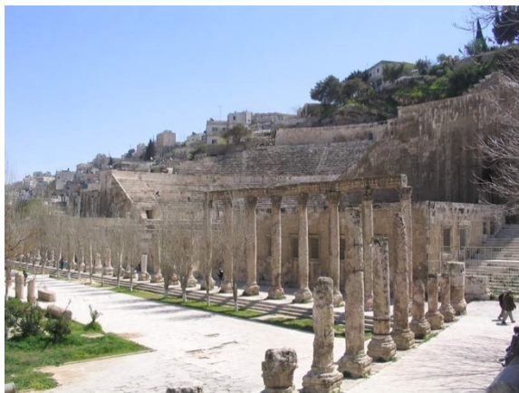
Рис. 3. Форум.