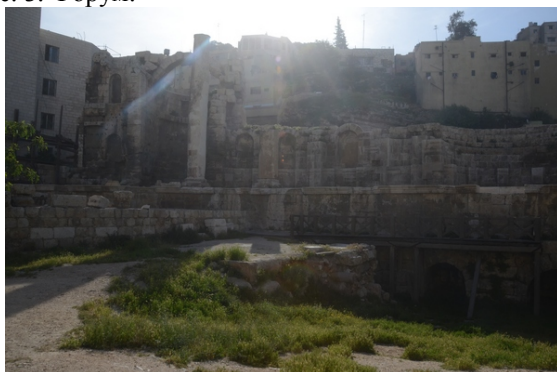
Рис. 4. Нимфейон.