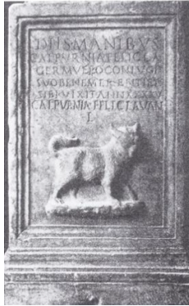
Рис. 9. Надгробие Кальпурнии Феликлы и её мужа с рельефным изображением котёнка или маленькой кошечки. Рим, II в.

Также кошачьи элементы распространялись в римской ономастике. Стали все более популярны когномены Cattus, Catulus, Cattius, Cattia, Felicla («кошечка») 3 . На многих римских надгробиях сделаны изображения с котами. Во II в. римская матрона Кальпурния Феликла создала совместное надгробие для своего мужа и себя, обыграв свое имя и сделав изображение кота на надгробии (Рис. 9) 4 .