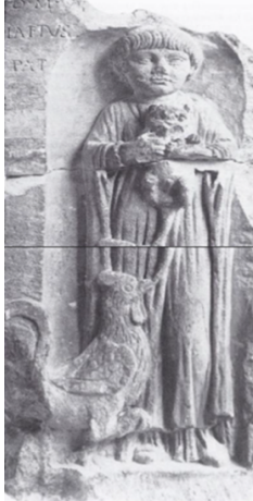
Рис. 10. Рельеф надгробия дочери некоего Лета (Laetus) с домашними котом и петухом. Бордо, 75-125 гг. н.э.

это её домашние любимцы, а возможно, кот и петух носят символическое значение. Кот – проводник в загробный мир, петух – символ исцеления и воскресения (Рис. 10) 1 .