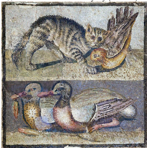
Рис. 11. Кот, охотящийся на утку. Мозаика. Помпеи, 79 г. н.э.

Коты, охотящиеся за птицами, изображены на римских мозаиках в Помпеях. На одной из них кот поймал утку (Рис. 11) 1 .