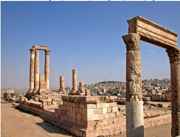
Рис. 1. Храм Геракла в Цитадели 1 .

Key words: Philadelphia, Amman, Decapolis, Rome, Byzantium, city.