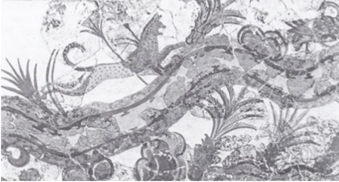
Рис. 1. Кот гонится за уткой в нильской местности. Фреска. Акротири, о. Фера (Санторин), 1628 г. до н.э.

Затем коты распространились и на других островах, в частности на Крите, в Минойском царстве, где находится много изображений на фресках этих животных (Рис. 1). Судя по внешности и размерам, это мог быть прирученный камышовый кот. Аналогичные сцены охоты были на фресках и вазах Микенской Греции (Рис. 2) 3 .