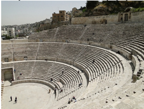
Рис. 2. Амфитеатр.