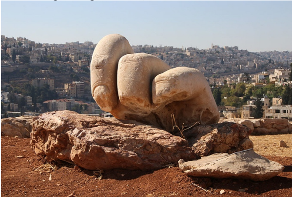
Рис. 1.2. Фрагмент колоссальной статуи у храма Геракла.