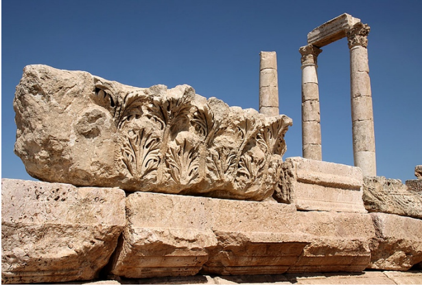
Рис. 1.1. Храм Геракла в Цитадели.