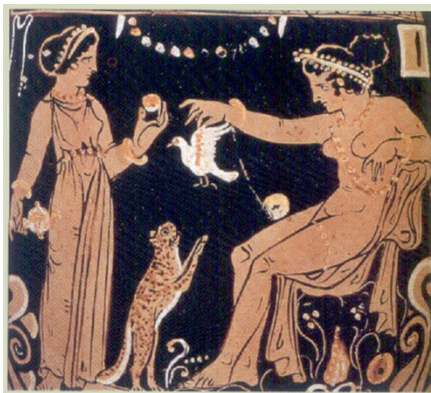
Рис. 7. Две женщины играют с котом. Лекана. Кампания, 330 г. до н.э.

и Регия привезли с собой кошек в VIII в. до н.э., почему их изображения были выбиты на монетах указанных городов. В Кампании кошки получили большое распространение и пользовались популярностью. 330 г. до н.э. датируется сосуд лекана, на котором детально изображены две женщины, играющие с кошкой (Рис. 7). Одна из них сидит в украшениях и обнаженная, держа в руке мячик, вторая стоит перед ней с плодом. Над кошкой порхает птица, возможно, голубь. Исследователи считают, что это богиня Афродита и её сопровождающая богиня Пейфо (Убеждение) 1 .