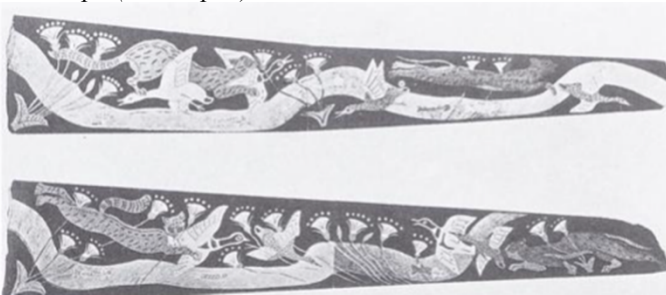
Рис. 2. Кот охотится на уток. Рисунок на обеих сторонах кинжала. Микенская Греция, II тыс. до н.э.