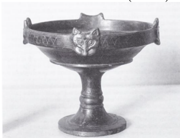
Рис. 8. Этруская чаша в стиле «буккери» (чернолощенная) с головой кошки на ободке. Кьюси, Тоскана, 470 г. до н.э.

Кошки пользовались популярностью в культуре этрусков. 470 г. до н.э. датируется ритон с головой кошки (Рис. 8) 2 .